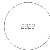
Das goldene Indien