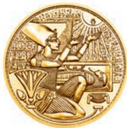
Das Gold der Pharaonen