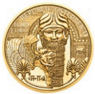
Das Gold Mesopotamiens